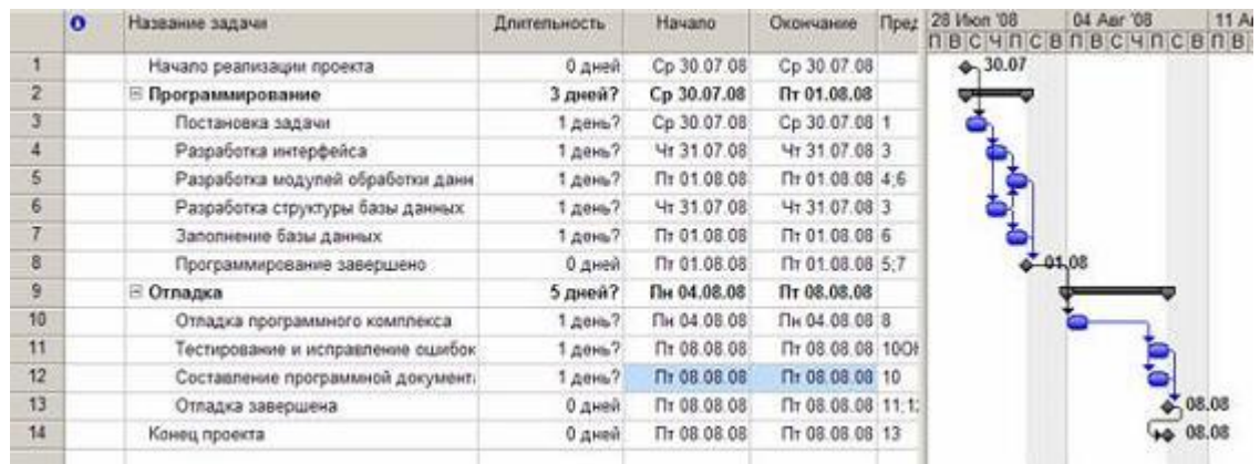
Рис. Результат преобразований